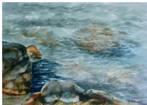
Hilario de las Moras