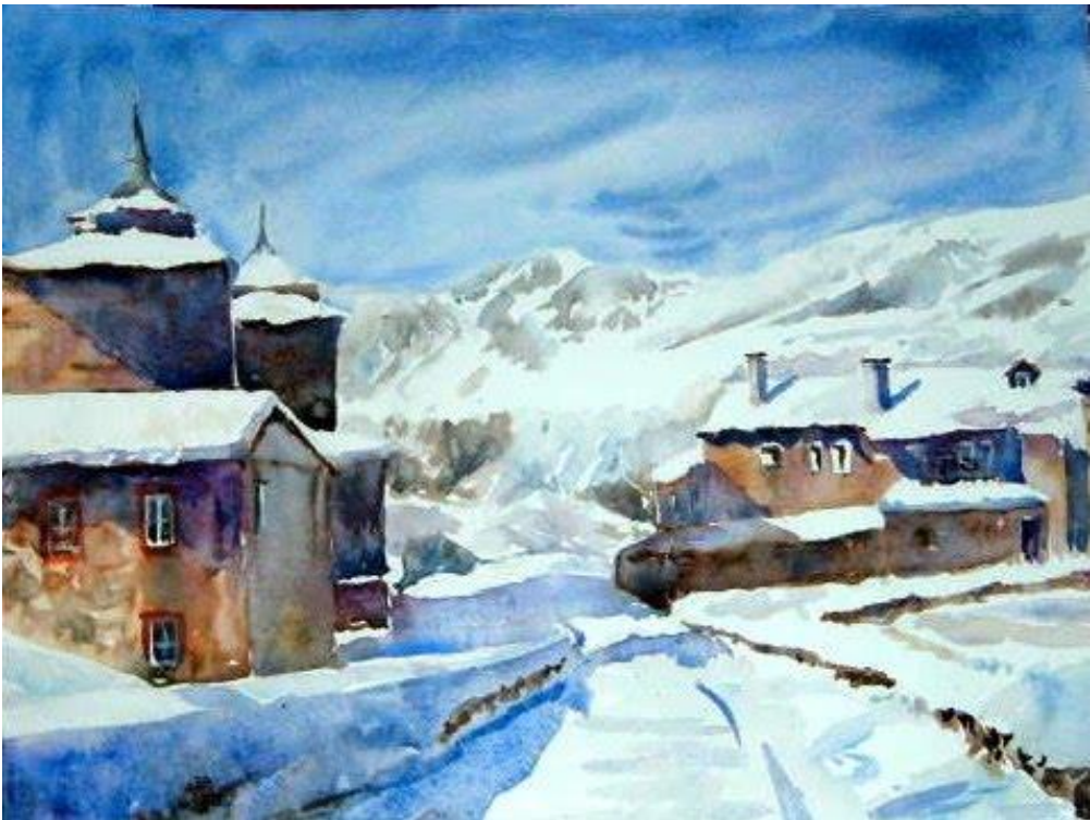
Acuarela de Carmen Jiménez